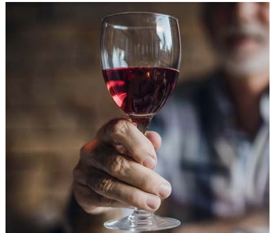
(Symbolbild mit Fotomodell)