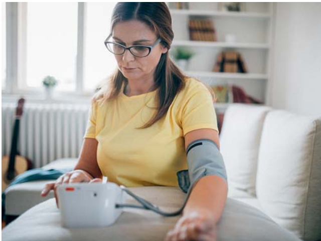
© mixetto / Getty Images / iStock (Symbolbild mit Fotomodell)

Gehirnleistung -- Auch junge Patienten sollten bei ersten Anzeichen für Bluthochdruck zunächst mit Lebensstiländerungen reagieren und, wenn diese keinen Erfolg zeigen, medikamentös behandelt werden. Denn eine arterielle Hypertonie schädigt in vielen Fällen die Organe, lange bevor Patienten ihre Erkrankung bemerken. Zu den geschädigten Organen gehört auch das Gehirn. Mit Blick auf eine aktuelle US-Studie berichten Gefäßexperten der Deutschen Gesellschaft für Innere Medizin, dass sich die negativen Auswirkungen der von der Jugend an erhöhten Blutdruckwerte in einem beeinträchtigten Gangbild und verringerter kognitiver Leistung wie etwa Vergesslichkeit bemerkbar machen.